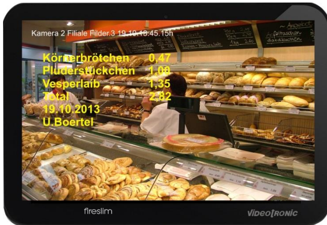
Auf Tablet oder Smartphone